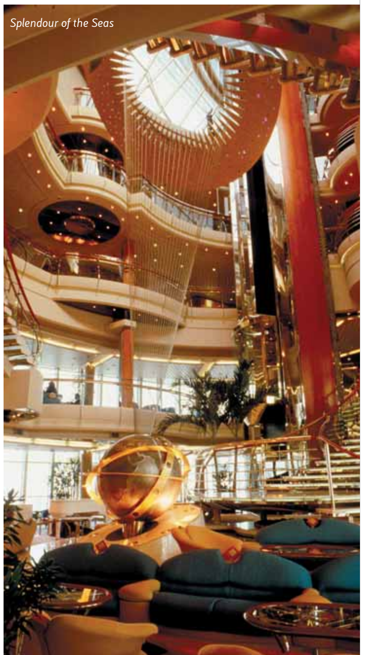
Splendour of the Seas