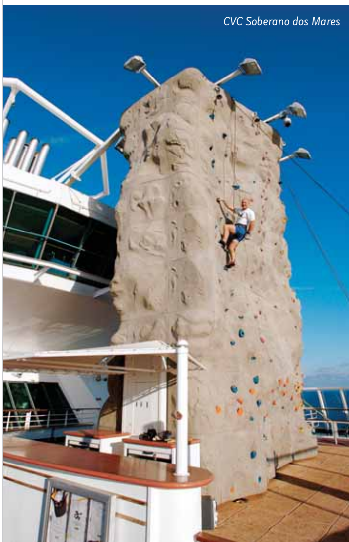
CVC Soberano dos Mares