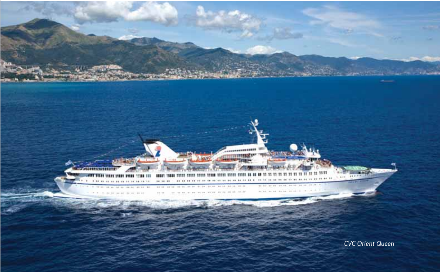
CVC Orient Queen

O primeiro dos novatos a aportar por aqui foi o MSC Lirica, que chegou ao Brasil em outubro. Com capacidade para mais de 2 mil hóspedes, sua base será o Porto do Rio, assim como a do MSC Opera. A outra novidade da empresa, o transatlântico Orchestra, terá suas saídas do Porto de Santos. Mas engana-se quem pensa que o navegante está restrito ao eixo Rio-São Paulo. Este ano, há uma grande aposta das empresas no Nordeste. A MSC destinou uma embarcação exclusiva para a região, o MSC Melody.