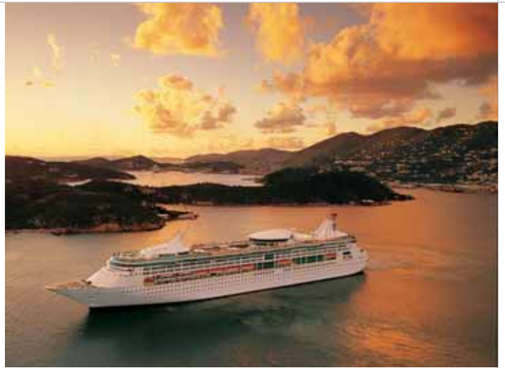
Vision of the Seas

Já para quem quer somente sombra e água fresca, há roteiros convencionais, nos quais o navio, por si só, já promete diversão o bastante. Enquanto cortam os mares de Búzios, Salvador, Ilhabela e outras joias do nosso litoral, os passageiros do Costa Concordia desfrutam de teatro, cinema e até de um simulador de Fórmula 1. No Splendour of the Seas e no Vision of the Seas – este último também estreado em