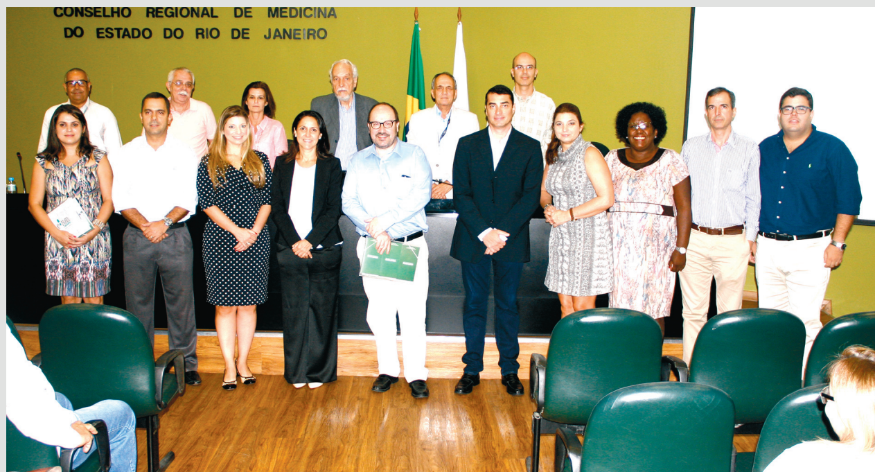
Conselheiros e diretores do CREMERJ com os novos integrantes empossados e diretores de hospitais