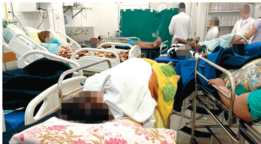
Superlotação da emergência do hospital de Japuíba

No Hospital Geral, os pacientes estão internados de forma improvisada e dividindo espaços reduzidos, com uma estrutura precária de atendimento. O