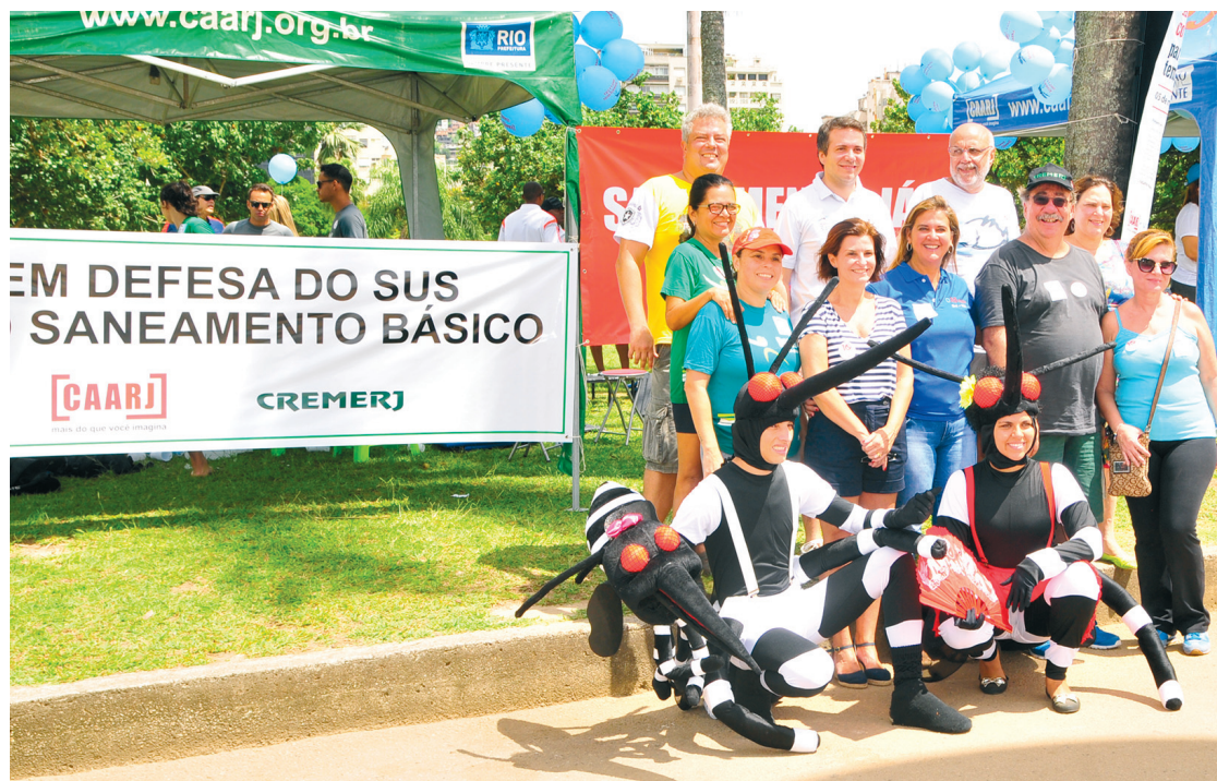
Médicos e diretores do CREMERJ durante a mobilização

Segundo dados do Sistema Nacional de Informações Sobre Saneamento (SNIS), 43% da população do