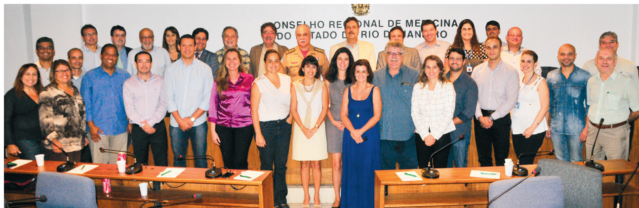
Conselheiros e representantes de unidades públicas e privadas do Rio