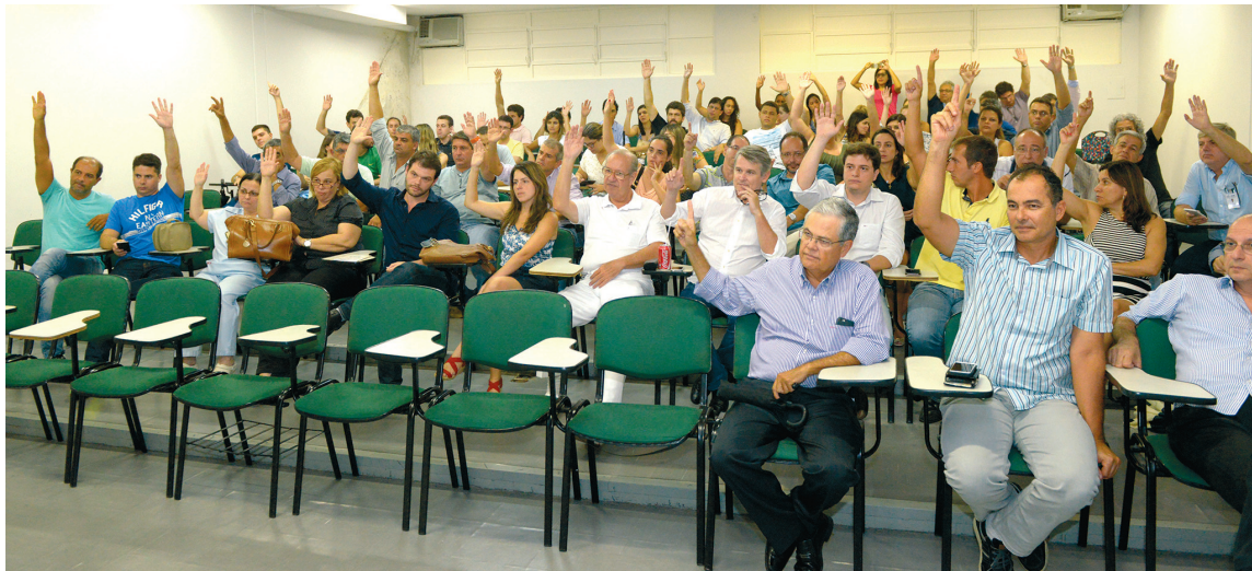
Primeira assembleia que decidiu a realização da greve

Ainda neste ano será produzido um documento com todas as reivindicações dos médicos que trabalham na rede pública de saúde da Região Sul fluminense, que será entregue aos candidatos a prefeito, para que firmem apoio às lutas e ao movimento, na busca de melhorias das condições da categoria e de atendimento à população.