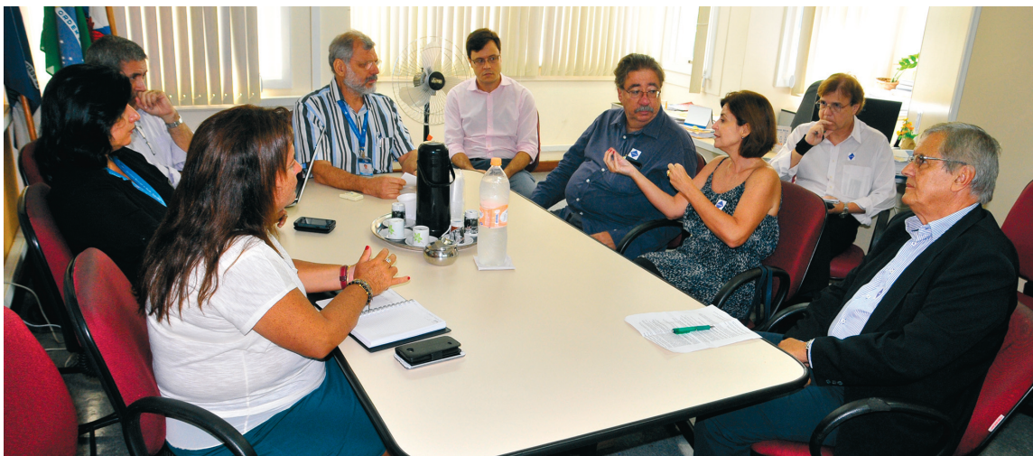
Conselheiros apresentam demandas dos médicos quanto às vistorias da vigilância sanitária

Os interessados poderão tirar dúvidas por meio de três canais: no site www.rio.org.rj.gov.br/vigilanciasanitaria , que oferece um passo a passo; no Fa-