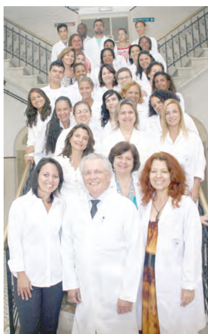
Equipe do Iede

Estado. Elas colhem o sangue e encaminham o material ao Iede, que é a única instituição que realiza o diagnóstico na rede pública fluminense. Apenas o da doença falciforme é encaminhado ao Hemorio, cujo resultado volta para o Iede.