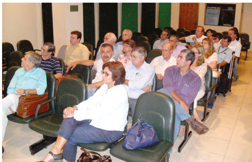
Endoscopistas em assembleia no auditório do CREMERJ

- Estamos conquistando vitórias importantes. Por isso, convocamos os colegas a participar desse movimento e contamos com o apoio dos endoscopistas nas assembleias - disse Alkamir.