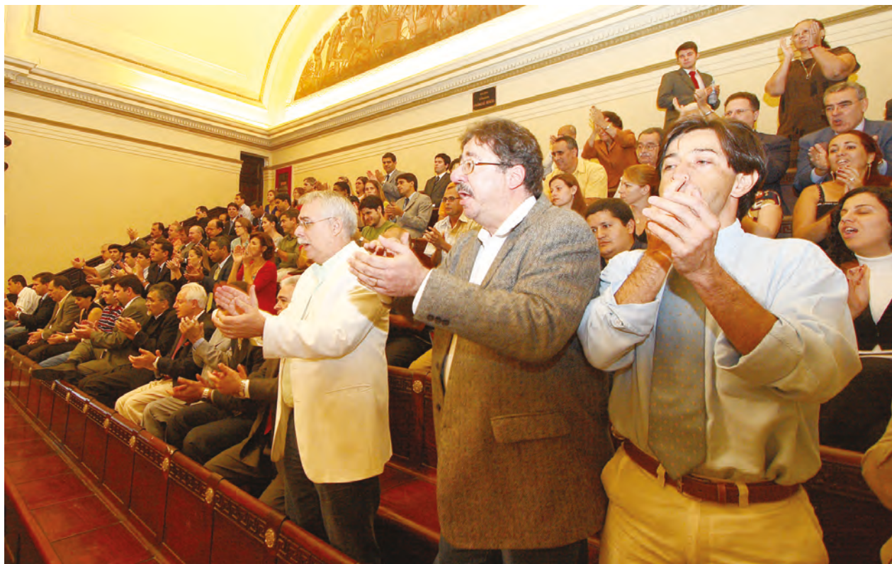
Conselheiros do CREMERJ, representantes de sociedades de especialidade e vários médicos aplaudiram a vitória da categoria em 2007