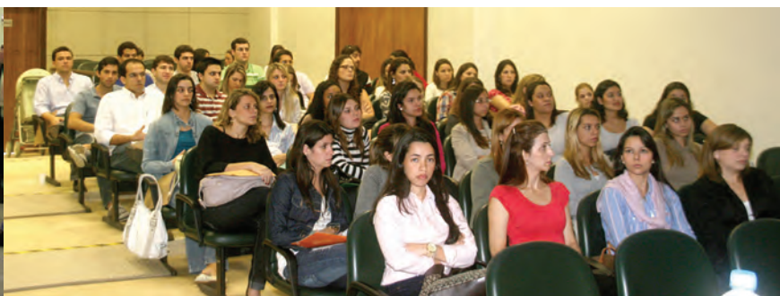
Universidade Estácio de Sá

RECÉM-FORMADOS • CREMERJ agiliza o registro e a emissão da carteira profissional com o número do CRM