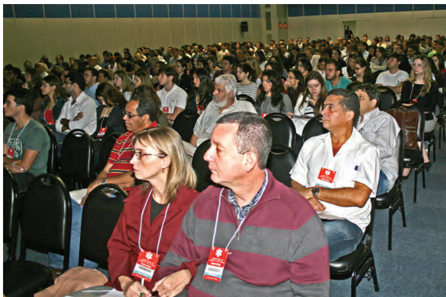
Módulo 2 sobre "Emergências cardiológicas" atraiu grande público