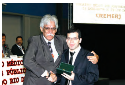
Jupiraci Damasceno e Sylvio Freire Hospital Estadual Adão Pereira Nunes