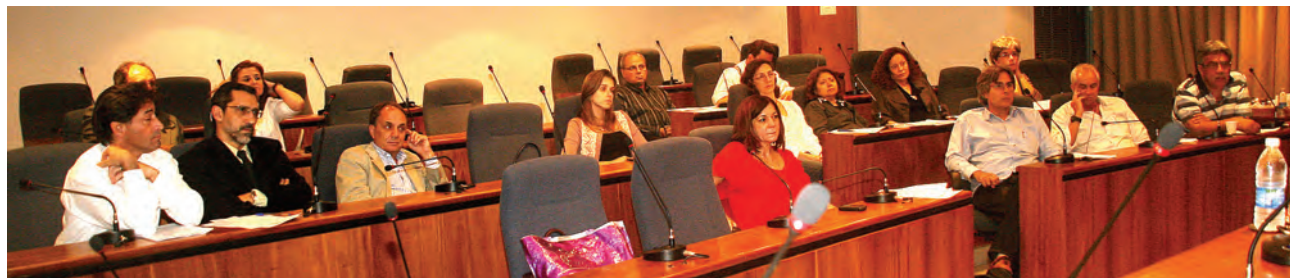
Representantes de Sociedades de Especialidade, SOMERJ, SMCRJ e Associações Médicas de Bairro se reúnem no CREMERJ para traçar os rumos do movimento

- A medida é inconstitucional e servirá apenas para abalar a relação médico-paciente. As operadoras, quando promovem credenciamento de médicos, só os aceitam como pes-