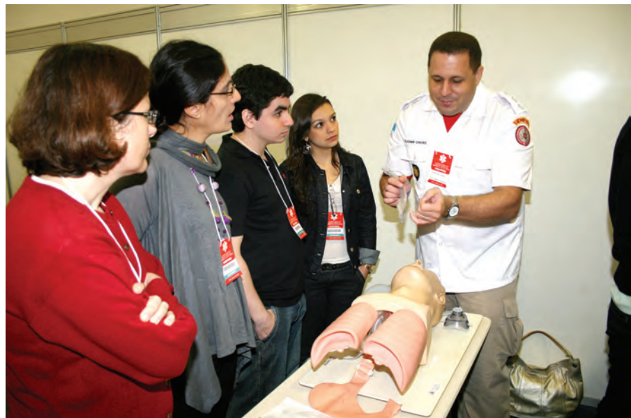
Oficina de abordagem às vias aéreas na emergência com atividades ministradas pelo 1º GSE