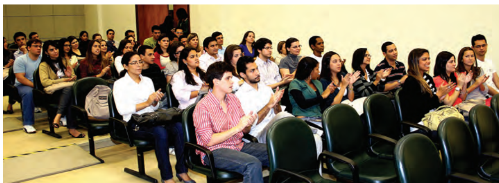
Universidade Federal do Estado do Rio de Janeiro

Durante a reunião com os formandos, os Conselheiros dão orientações importantes para as atividades do dia a dia no exercício da medicina