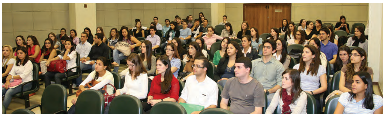
Universidade Federal do Rio de Janeiro