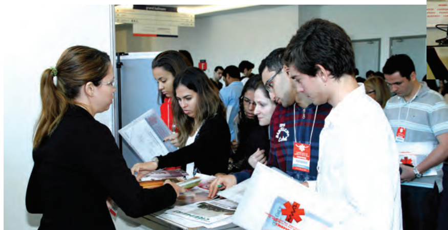
Estande do CREMERJ: acadêmicos de medicina se interessam por folders e pela carteira do interno