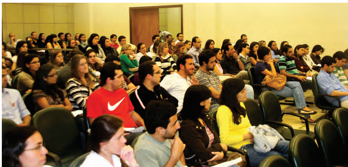
Participantes da reunião do dia 20 de junho, realizada na sede do CREMERJ, votaram pela paralisação das atividades no dia 29

RECÉM-FORMADOS • Em recente assembleia, categoria suspendeu greve, mas Amererj vai continuar a luta pela emenda que institui reajustes anuais