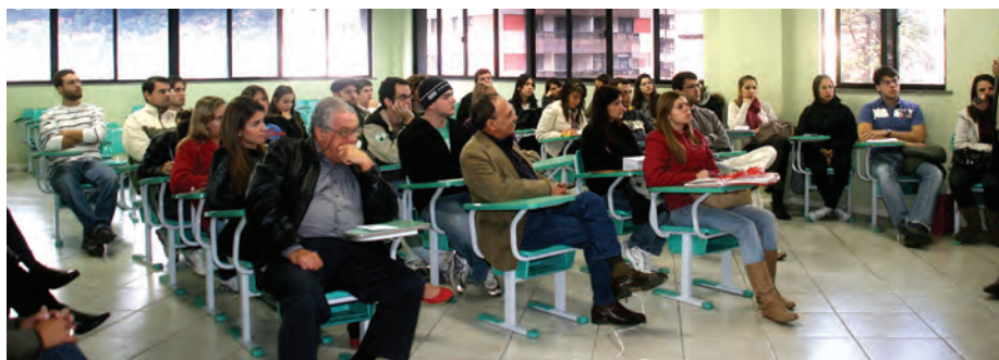
Faculdade de Medicina de Teresópolis