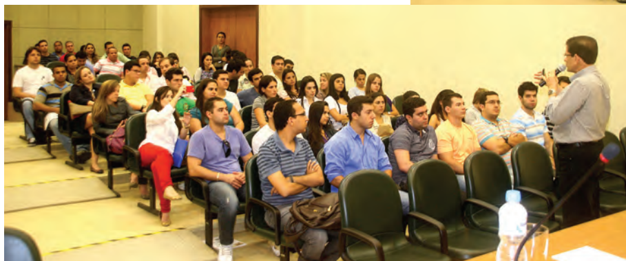
Universidade de Nova Iguaçu

Durante a reunião com os formandos, os Conselheiros dão orientações importantes para as atividades do dia a dia no exercício da medicina