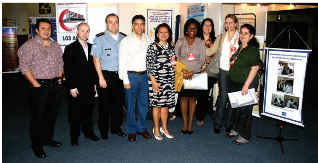
Estande do Hospital Souza Aguiar: médicos do corpo clínico demonstraram sua produção assistencial