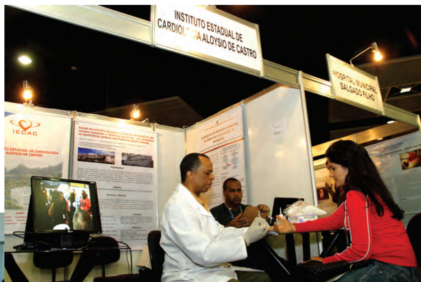
Estande do Instituto de Cardiologia Aloísio de Castro: realização de exames nos congressistas