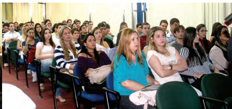
Universidade de Nova Iguaçu - unidade de Itaperuna