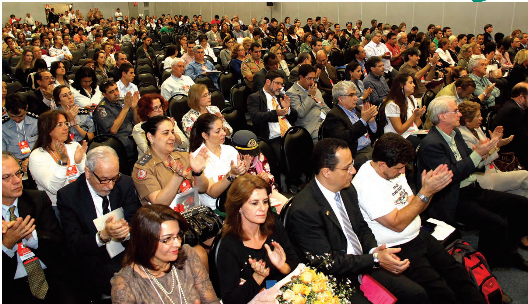
Médicos e acadêmicos lotaram as salas onde foram realizadas as palestras e as atividades práticas, durante todo o evento, mostrando o sucesso da programação do congresso