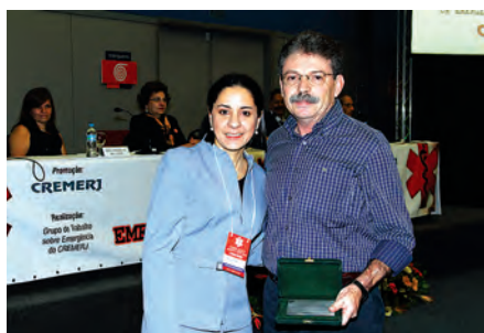
Eliane Burd e Marcelino Neiva Hospital Estadual Rocha Maia