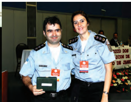
Leandro de Andrade e Andréa Caltabiano Hospital Central da Polícia Militar