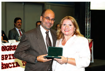
Marco Antonio Cordeiro e Maria de Fátima Teixeira Hospital Municipal Paulino Werneck