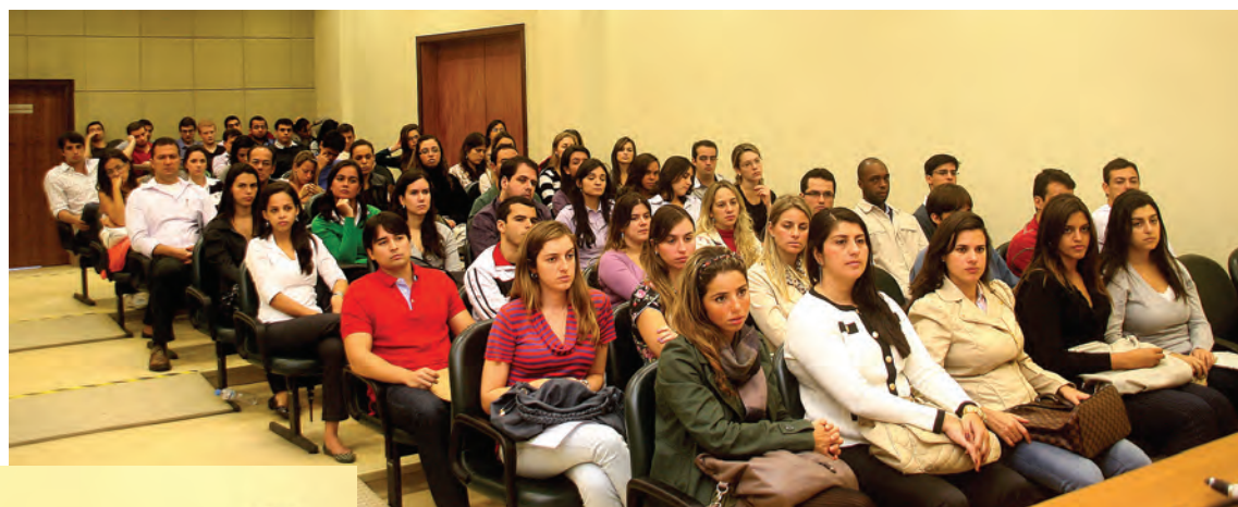
Universidade Gama Filho