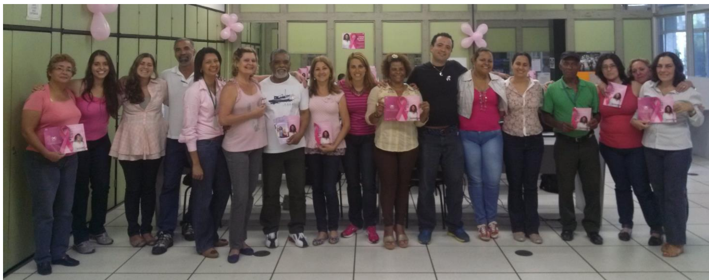
Equipe da UFRJ-BC-CCS

O principal objetivo deste Guia é fornecer elementos para agilizar a comunicação entre os bibliotecários da área de Informação em Saúde.